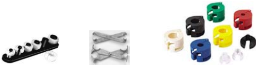
Diagramme 3 – Échantillon de trousse d’assemblage avec raccords à branchement rapide: