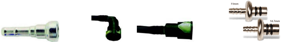
Diagramme 2 – Outils de déconnexion pour raccords à branchement rapide